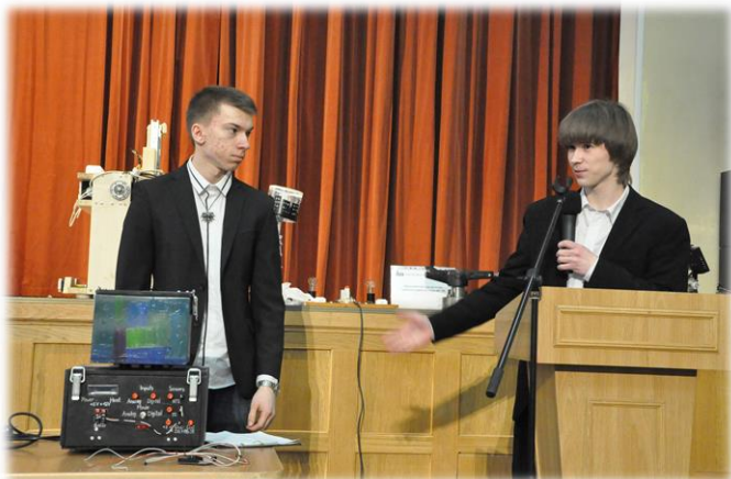
Конкурс проектов технического творчества «Молодежь и техника»