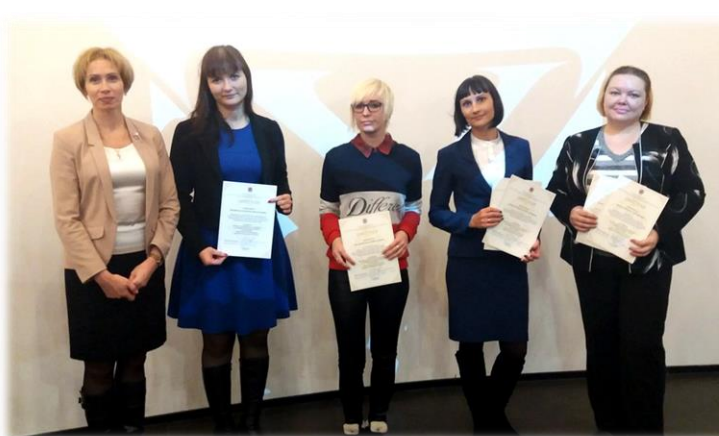
Конкурс видеороликов «Профессия-2016»