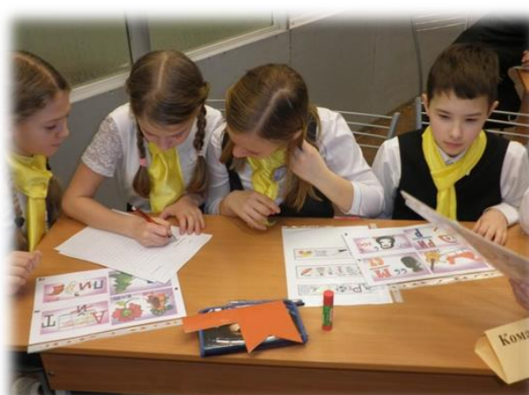
Городская профориентационная игра «Профессии от А до Я»