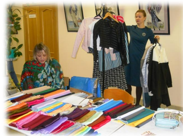
VIII Городской Фестиваль профессионального мастерства «Магия стиля»