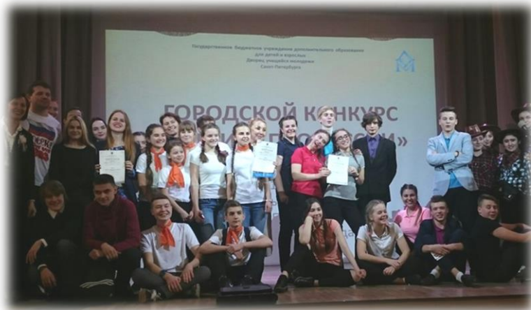
Городской конкурс «Защита профессий»