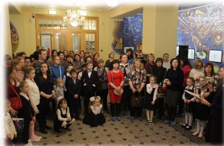
Конкурс по профориентации для обучающихся ОУ «Когда профессия – это творчество»