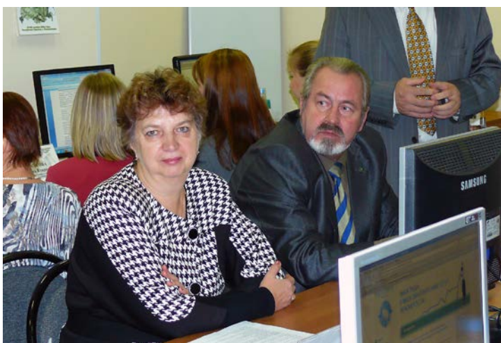
Улыбка от членов Оргкомитета