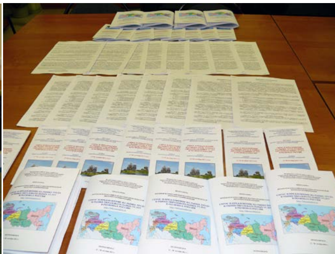
Раздаточные материалы для участников на открытии Интернет-конференции