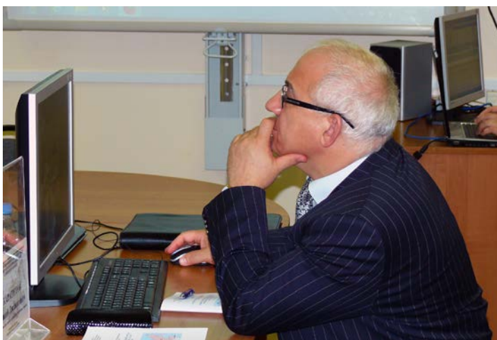
Есть над чем подумать