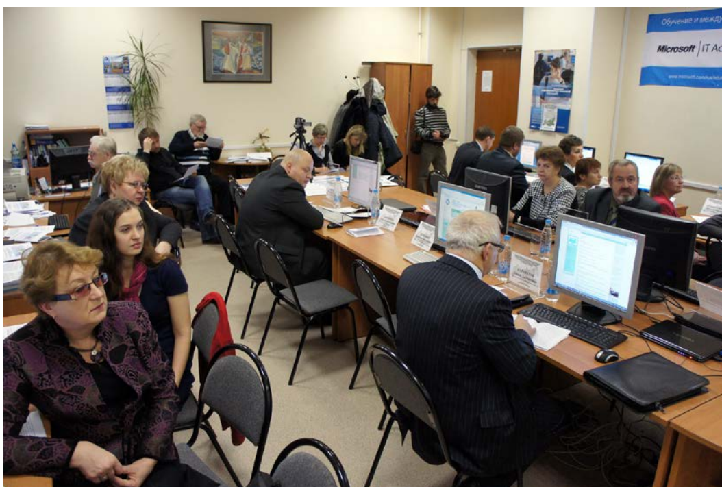
Общий вид конференц-зала во время открытия Интернет-конференции.