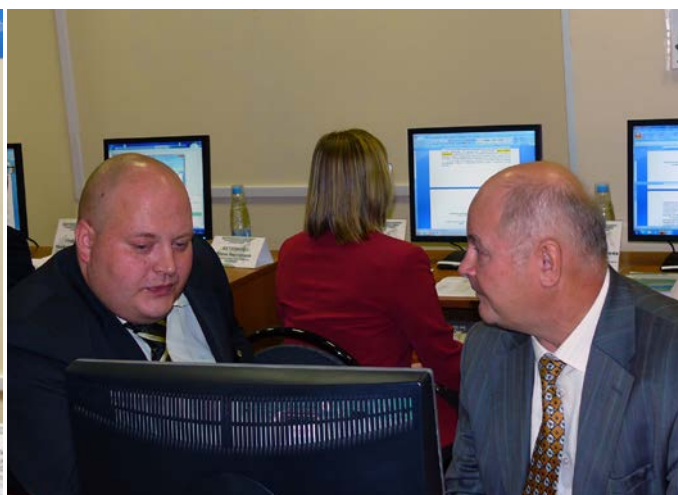
Беседа о дальнейшем взаимовыгодном сотрудничестве