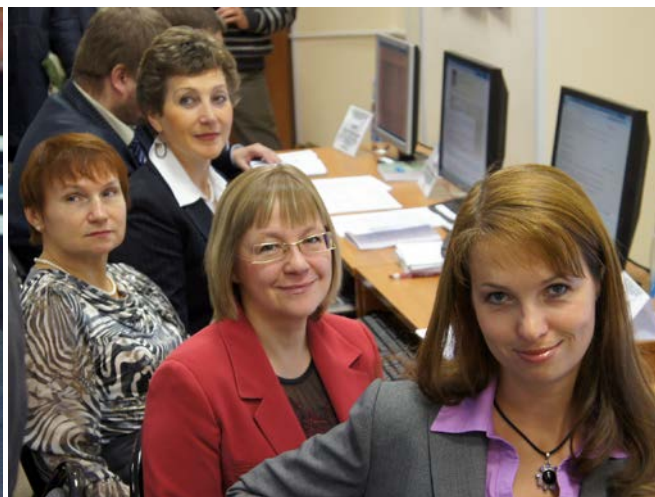
Хорошее настроение работе не помеха