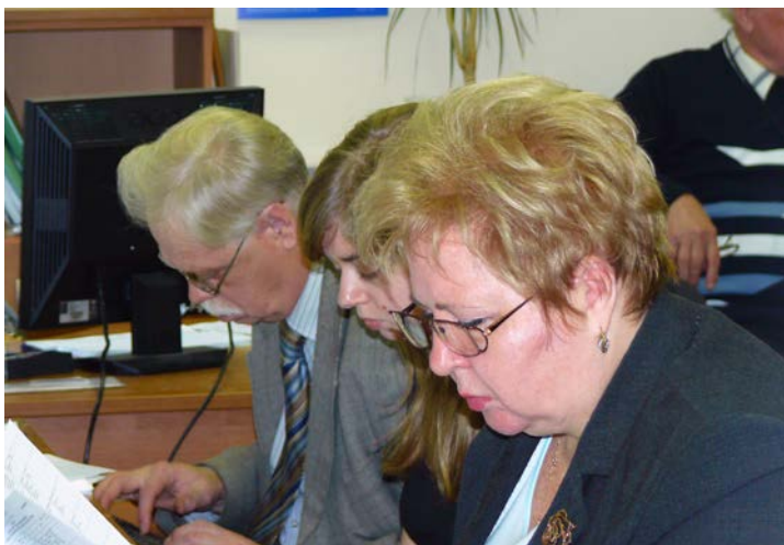
Работа в секции