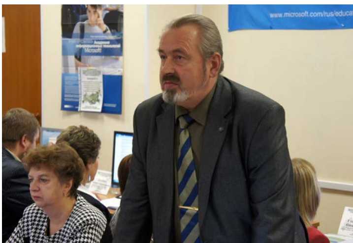
Приветствие от ректора ПетрГУ