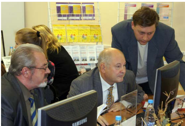
Вопросы по организации формы общения в конференц-зале