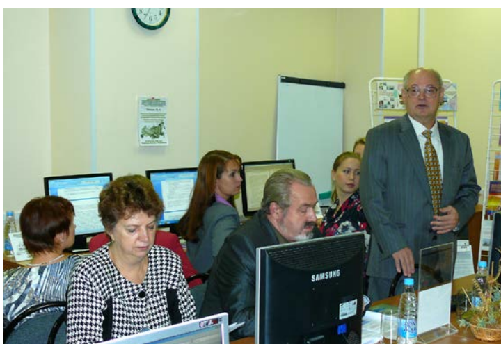
Информация от организаторов Интернет-конференции