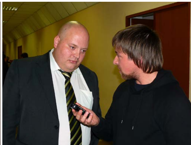
Интервью средствам массовой информации