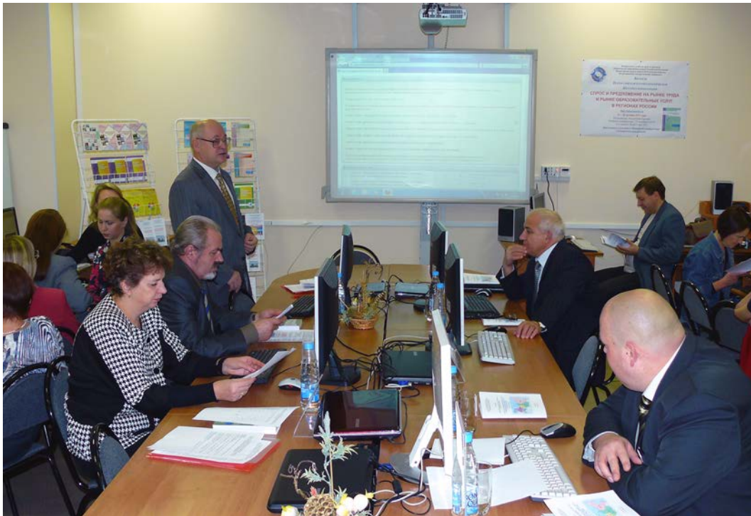
Общий вид конференц-зала во время открытия Интернет-конференции

К началу конференции вышла книга 1 Сборника докладов конференции, которая включает 33 доклада. По итогам конференции будут изданы книги 2 и 3 Сборника докладов Интернет-конференции. Часть лучших докладов, рекомендованных руководителями секций, будут опубликованы в журнале "Ученые записки ПетрГУ".