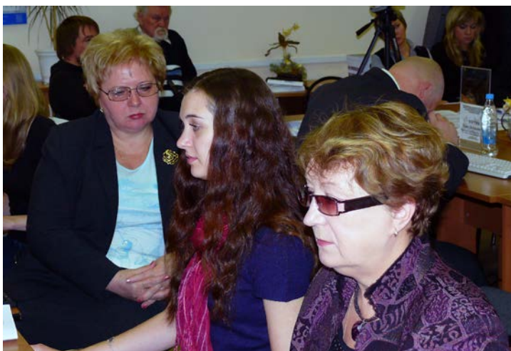
Ответы участникам Интернет-конференции