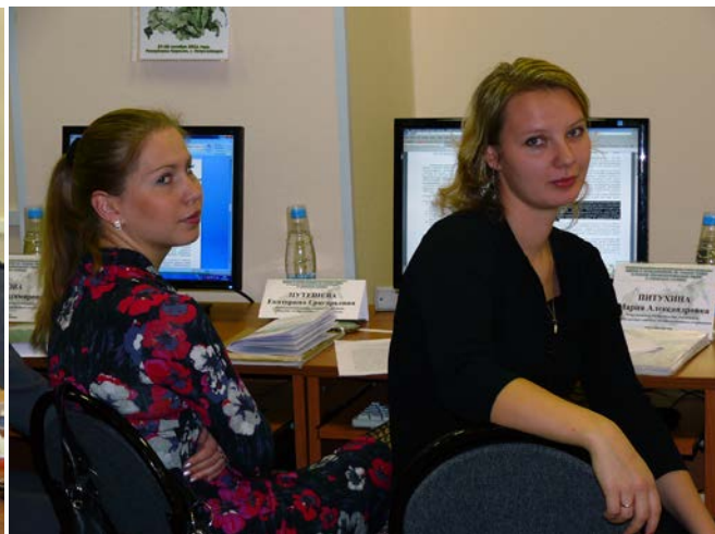
Фотография на память