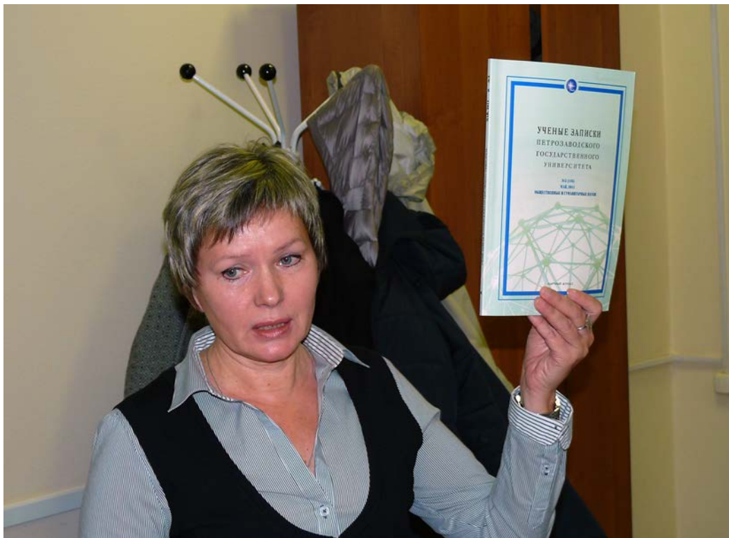
Презентация журнала ВАК «Ученые записки Петрозаводского государственного университета», в который выборочно войдут статьи участников Интернет-конференции.