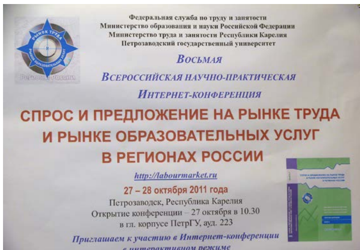
Объявление о проведении Интернет-конференции