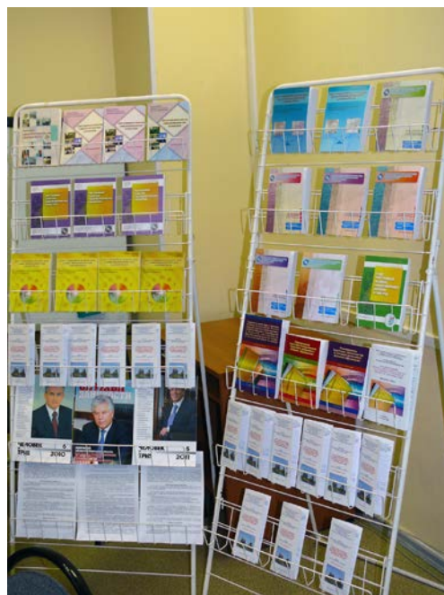
Стенд с информационными материалами