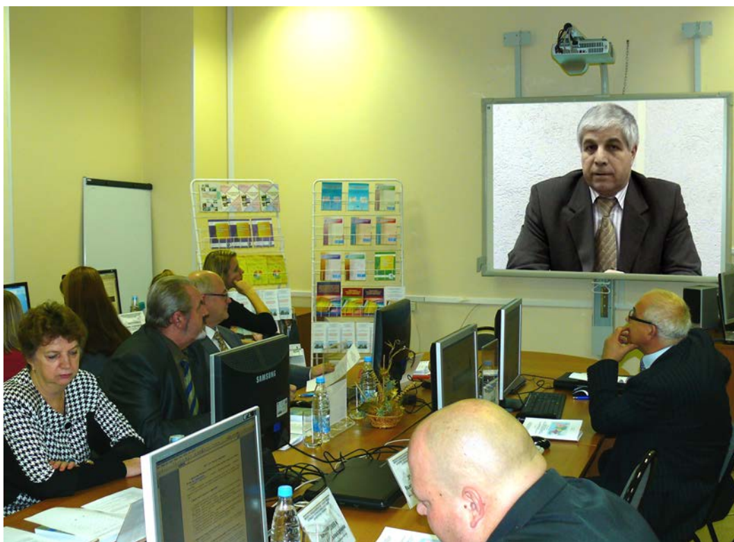
Видеоприветствие участникам Интернет-конференции: Лунцевич Валентин Васильевич – министр экономического развития Республики Карелия.