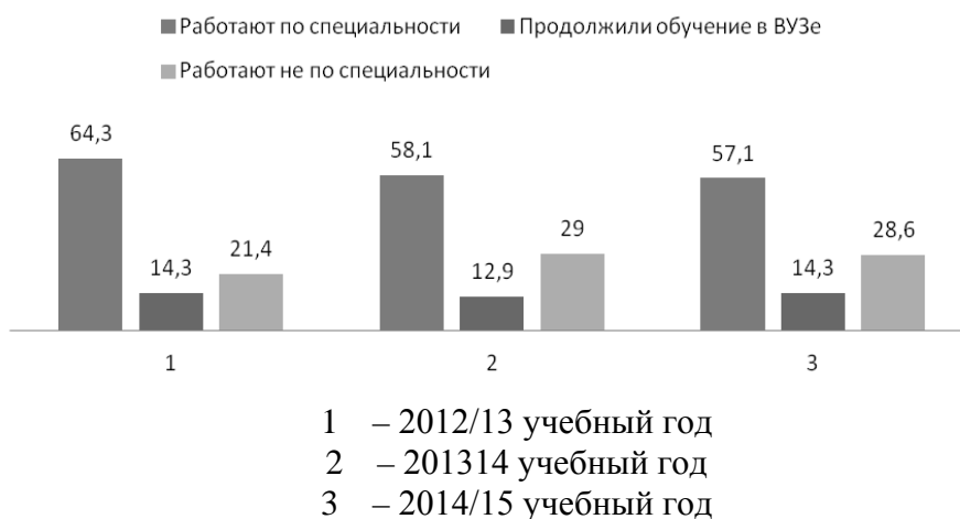
Рис. 2. Гистограмма трудоустройства выпускников