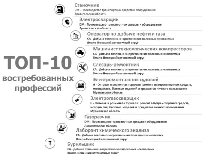
Рис. 4. Топ-10 востребованных профессий на территориях АЗ РФ по результатам опроса ведущих компаний-работодателей

Топ-10 востребованных профессий составляют преимущественно рабочие профессии, востребованные в реальном секторе экономики (производство транспортных средств, добыча полезных ископаемых и др.).