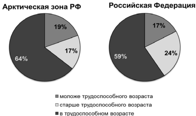
Рис. 2. Распределение населения Арктической зоны РФ по возрасту в сравнении с РФ в целом (на 1 января 2014 г.)

При этом в Арктике преобладает более молодое население по сравнению с РФ (рис. 2). Предположительно это связано с тем, что лица пенсионного возраста после окончания трудовой деятельности покидают территории, отнесенные к Арктической зоне, и переезжают в места с более благоприятными природно-климатическими условиями.